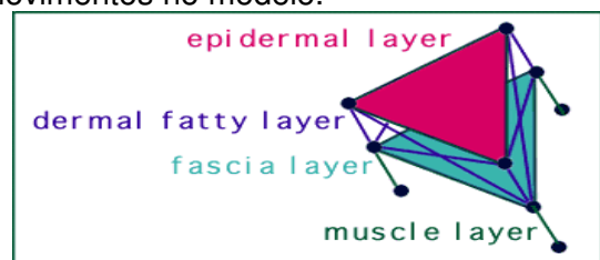
Figura 1: Modelo das camadas da face desde a superfície até os músculos

da face). O modelo desenvolvido é modificado a partir da simulação da ativação de vários músculos, reproduzindo diferentes movimentos faciais, da mesma forma como os músculos da face humana são movidos. Havendo uma correspondência direta entre os músculos humanos reais e seus movimentos no modelo.